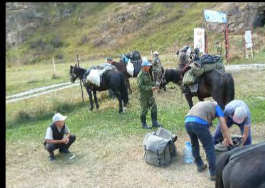
... le chargement et l'attribution des montures pour l'expédition