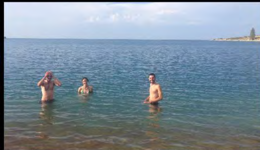
Pour les plus courageux...baignade au lac Issik-Kul (Alt : 1600m)