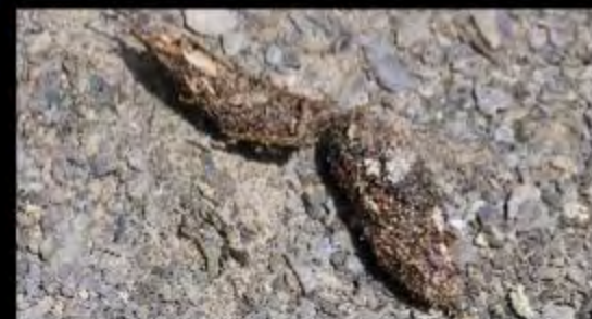
Fèces de panthère des neiges / Crottes de tétraogalle