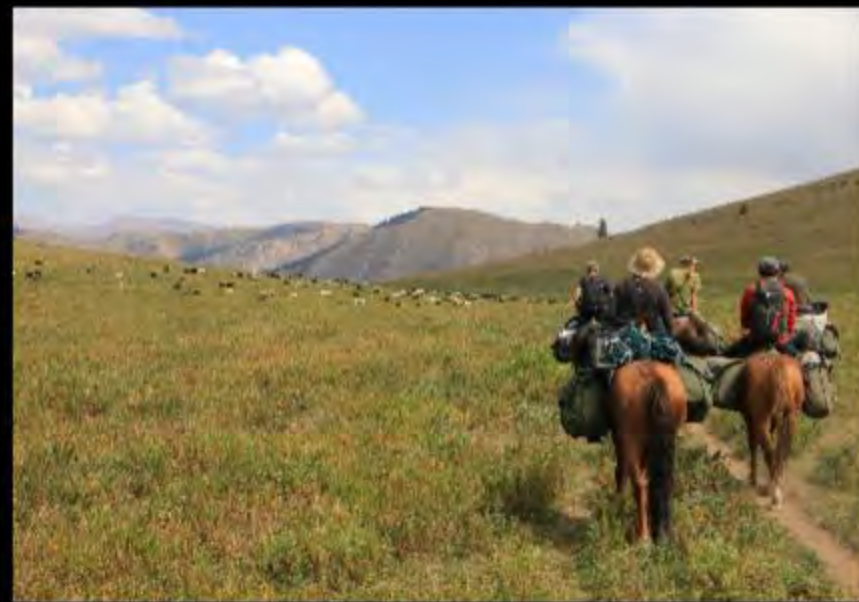
En route pour l'aventure dans la réserve de Naryn!