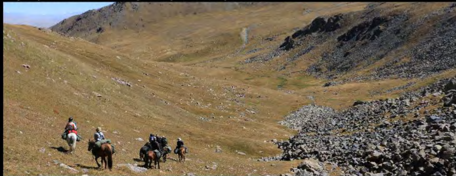
Départ pour la vallée d'Ulan en passant par les hauts-plateaux