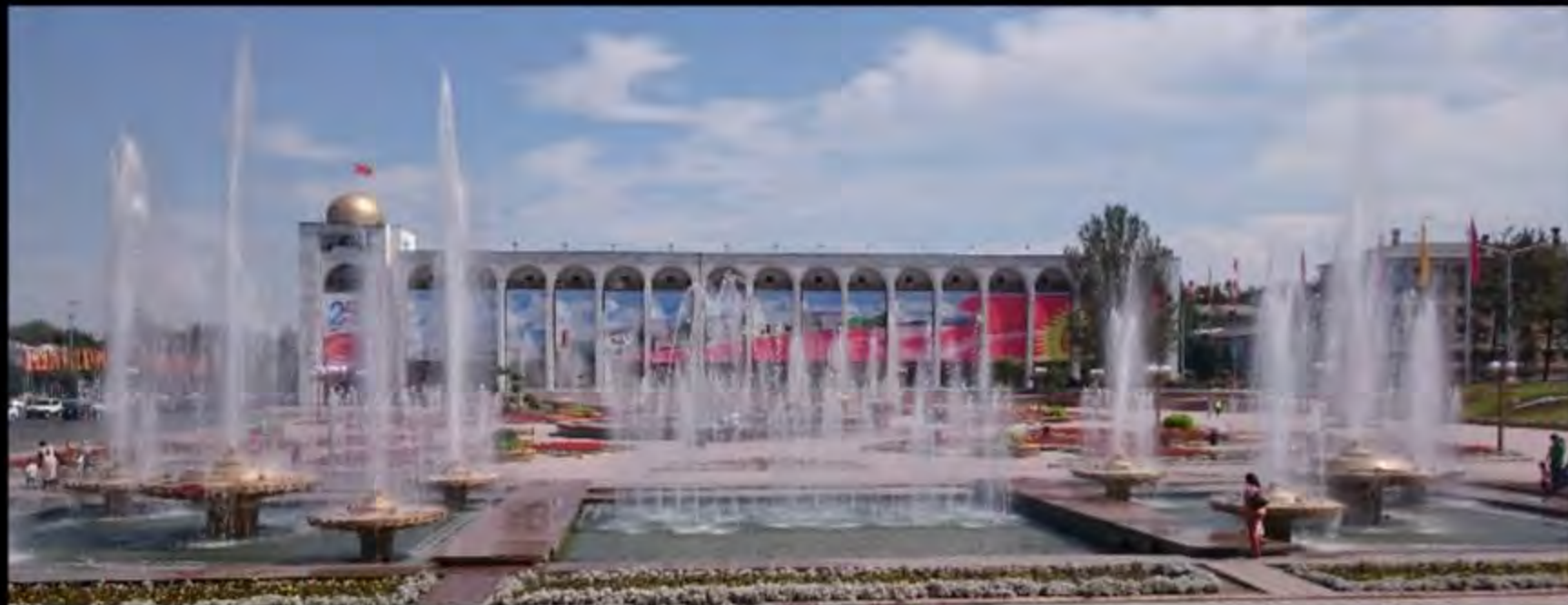
Bishkek : Place Ala-Too & Statue de Manas / \> Entrée du marché d'Osh bazar