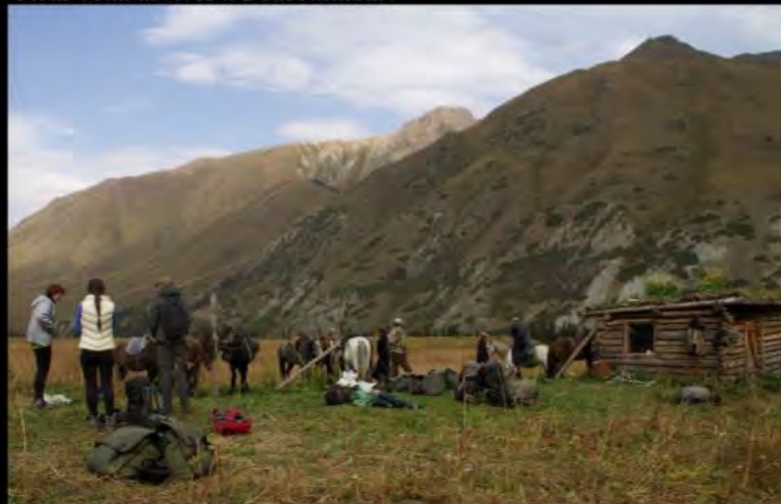
Nous voilà arrivés à Deubeutateur!