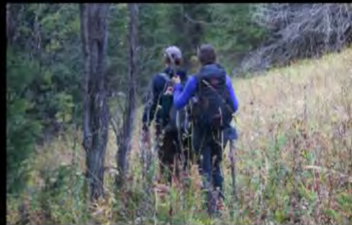
A la recherche d'indices...