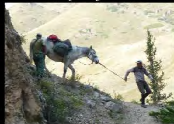
avec des passages délicats