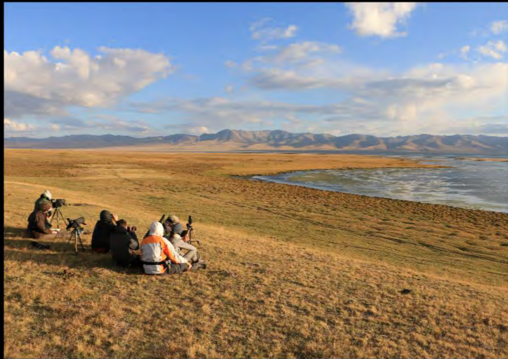
Observation au lac Song Kul avec le garde