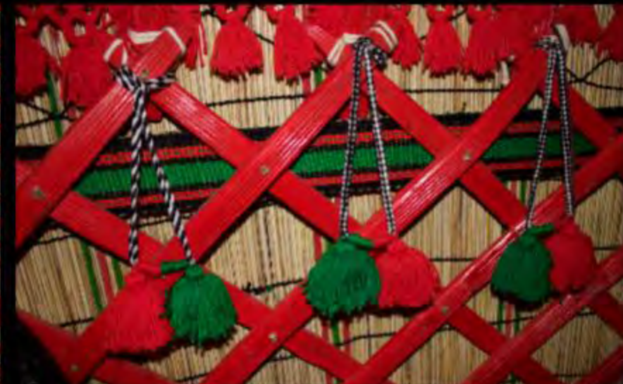
À l'intérieur de la yourte