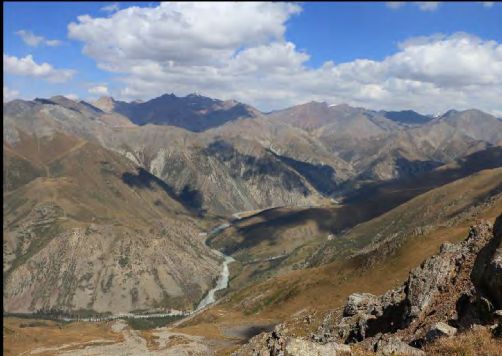
Vue depuis le col d'Arpatekter