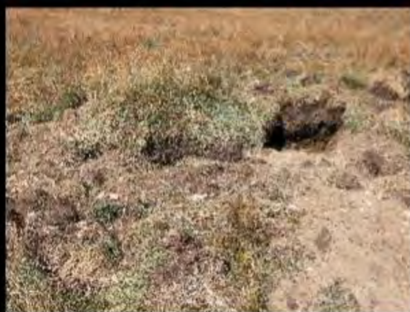
Déterrage de marmotte par un ours