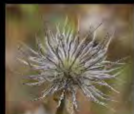
Pulsatille / Aster