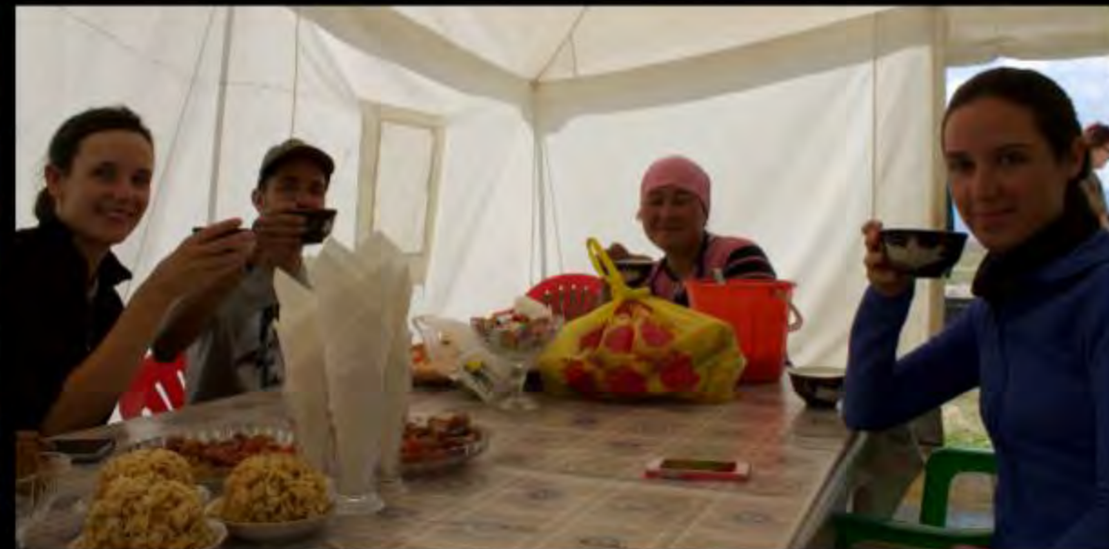
À la vôtre! Que c'est bon le Koumiss!