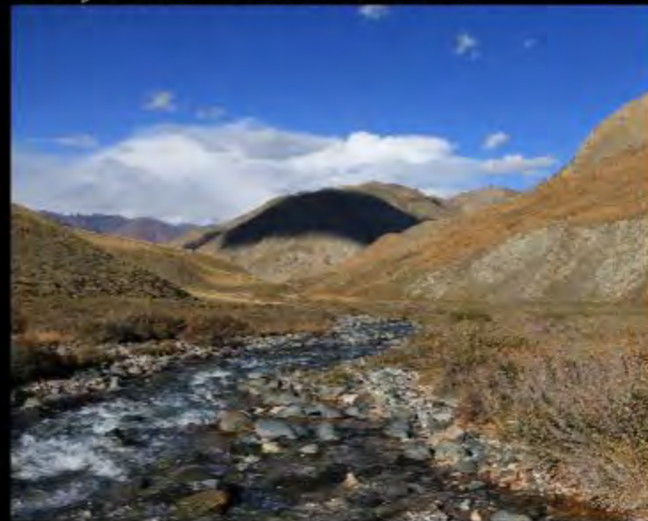
Prospection dans la vallée d'Ulan