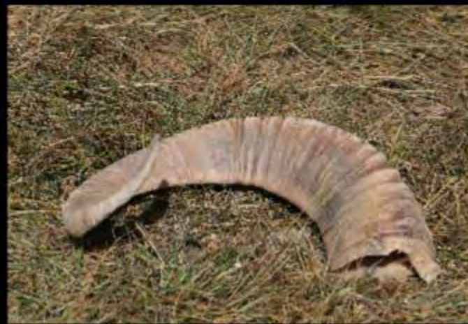
Corne de Mouflon de Marco Polo