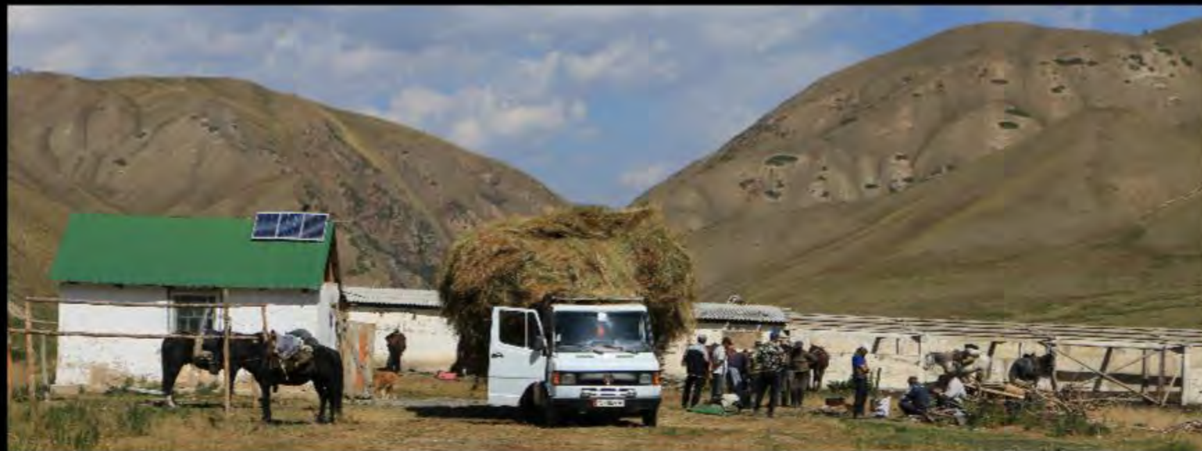
Karatash - Ferrage des chevaux, casse-croûte avant...