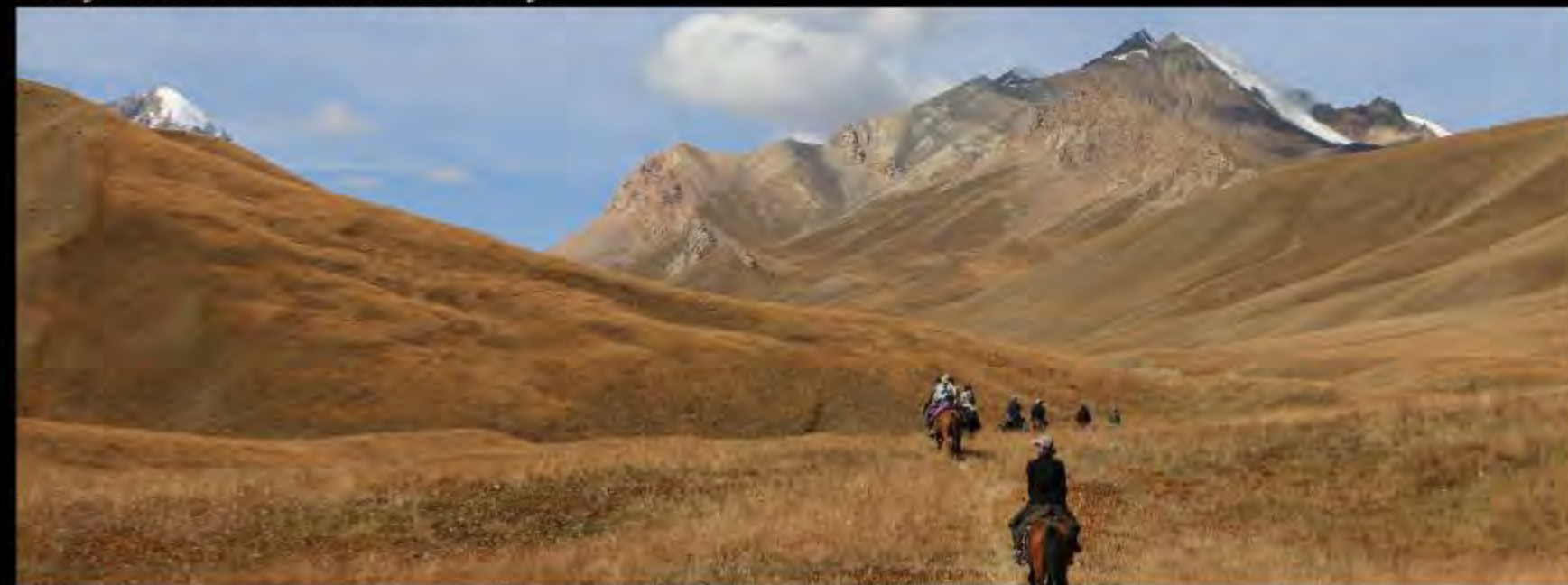
Prospection dans la vallée de Karatyr