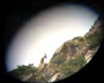
'Bouquetin de Sibérie