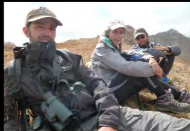
Départ pour la maison des gardes d'Ulan