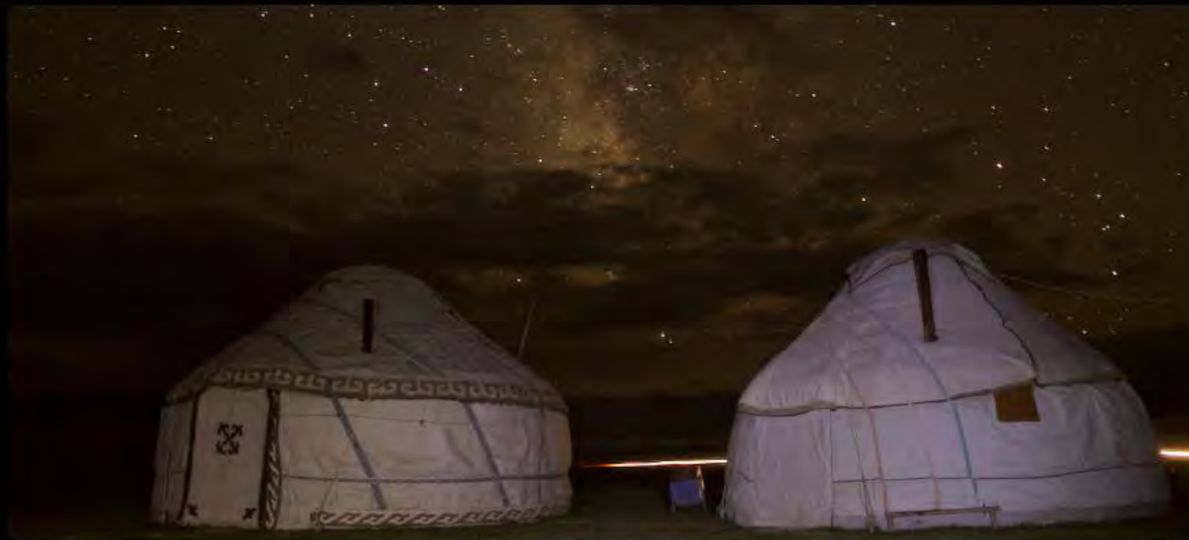
Balade aux abords du lac Song Kul avec les chevaux kirghizes!