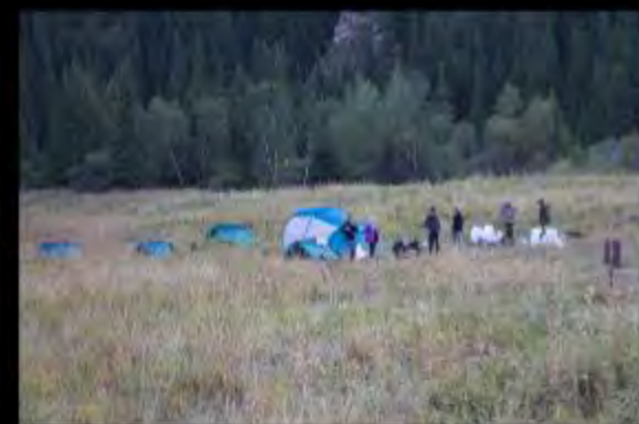
Premier bivouac - Karatash