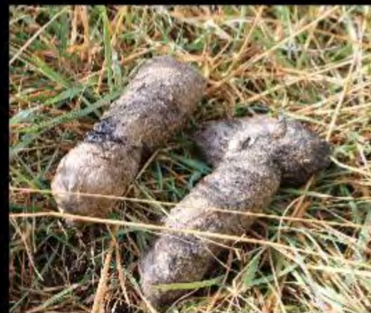
Crottes de loup