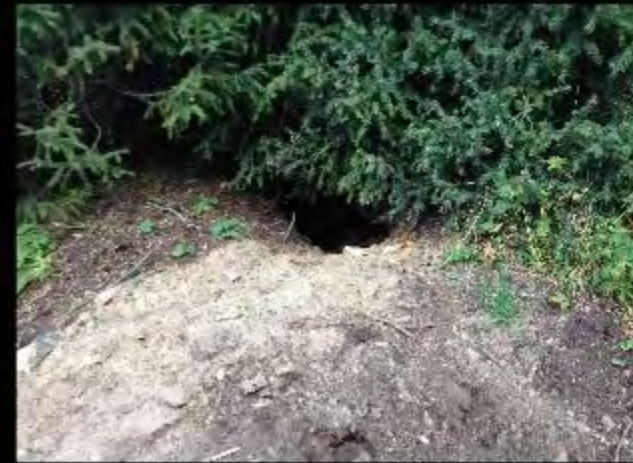
Déterrage de marmotte par un ours